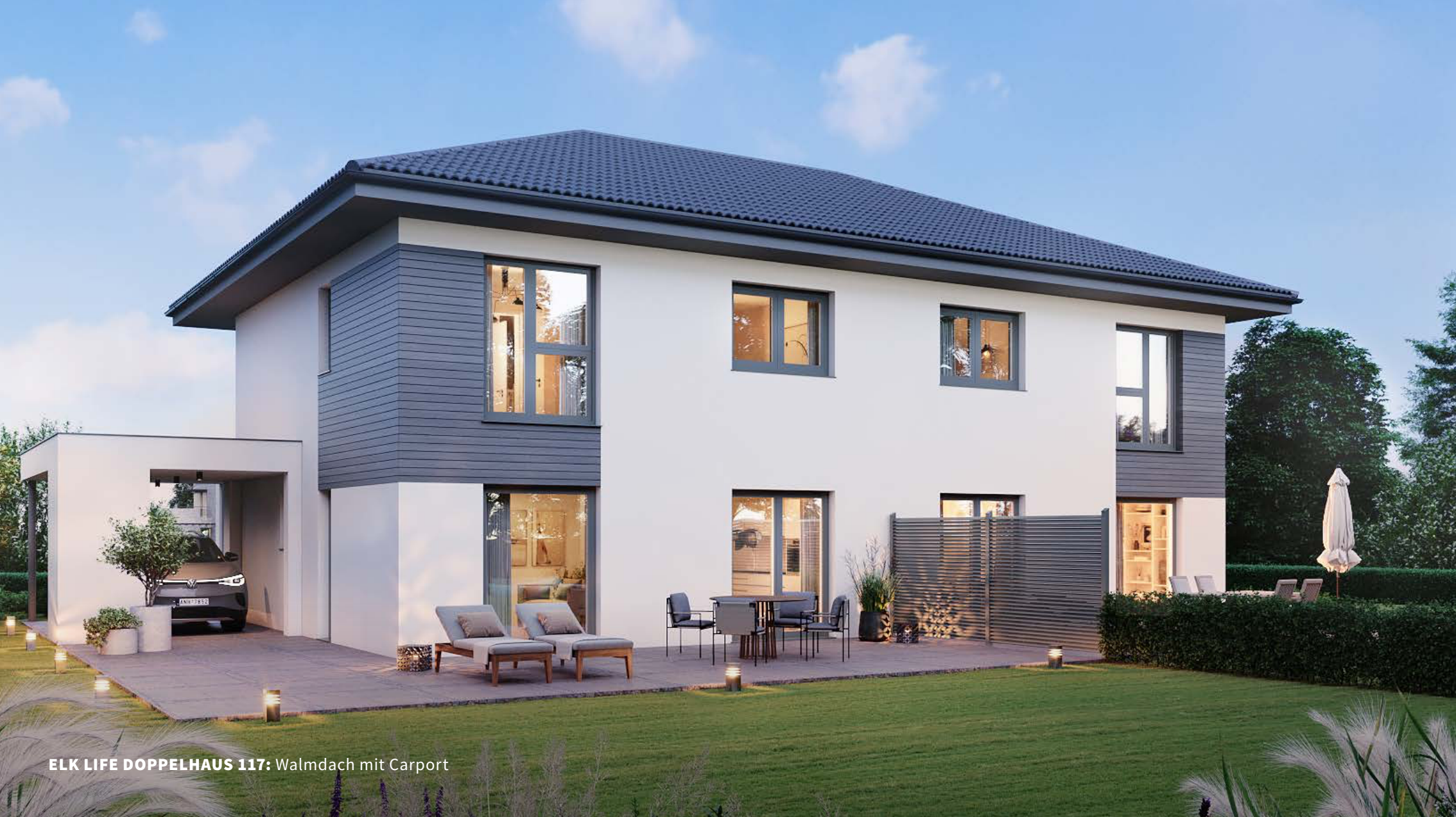
ELK LIFE DOPPELHAUS 117: Walmdach mit Carport