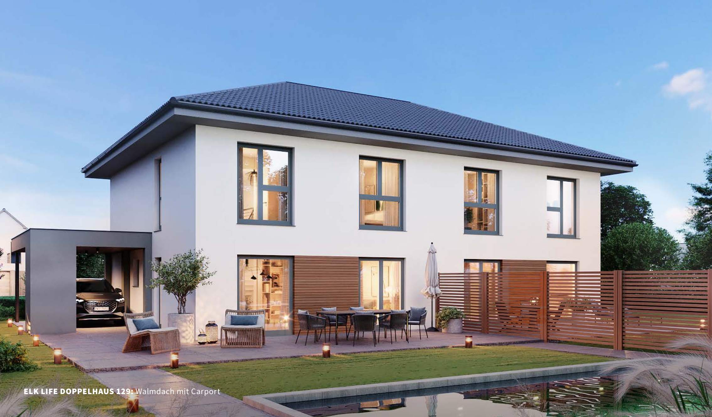
ELK LIFE DOPPELHAUS 129: Walmdach mit Carport