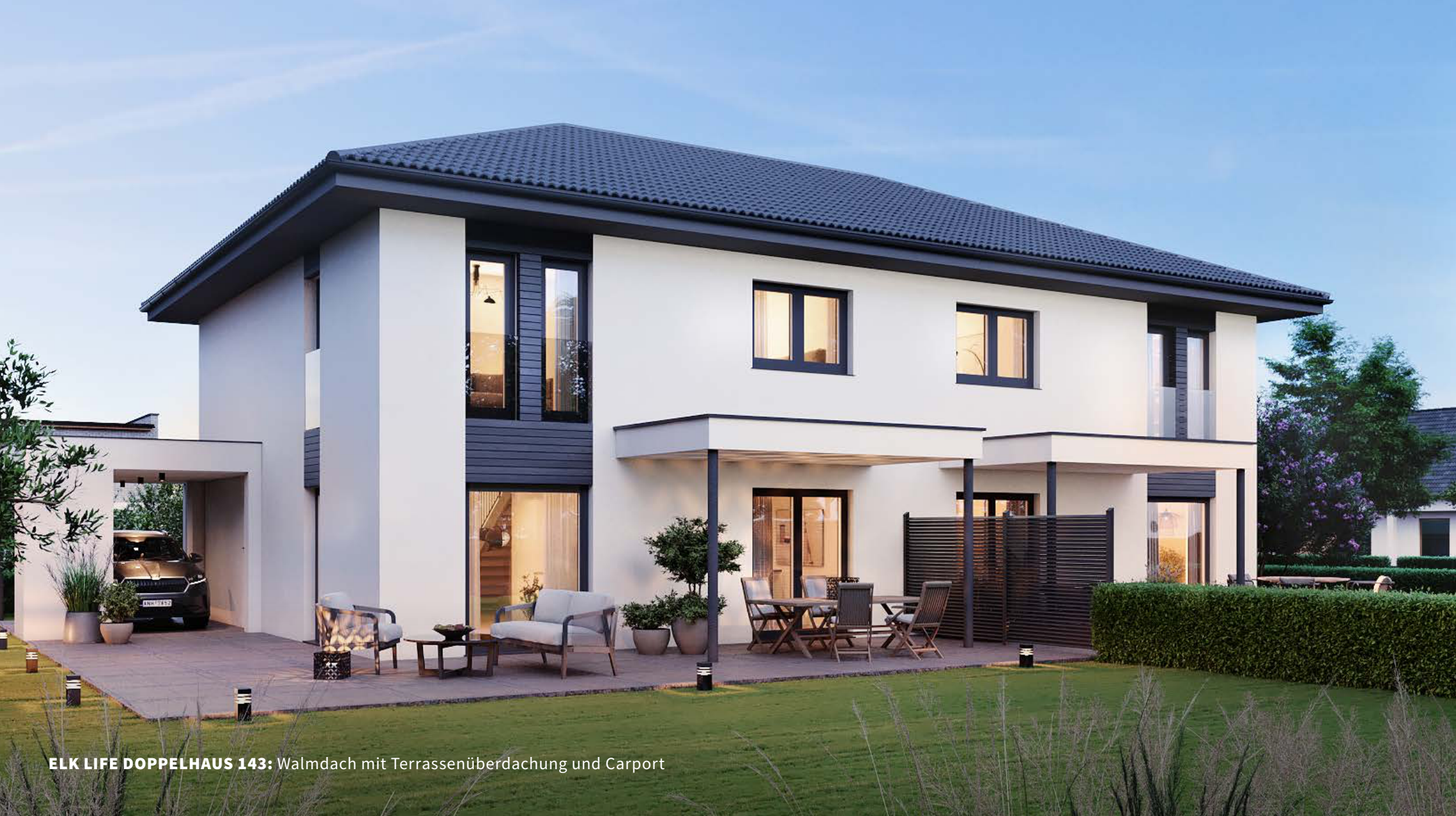
ELK LIFE DOPPELHAUS 143: Walmdach mit Terrassenüberdachung und Carport