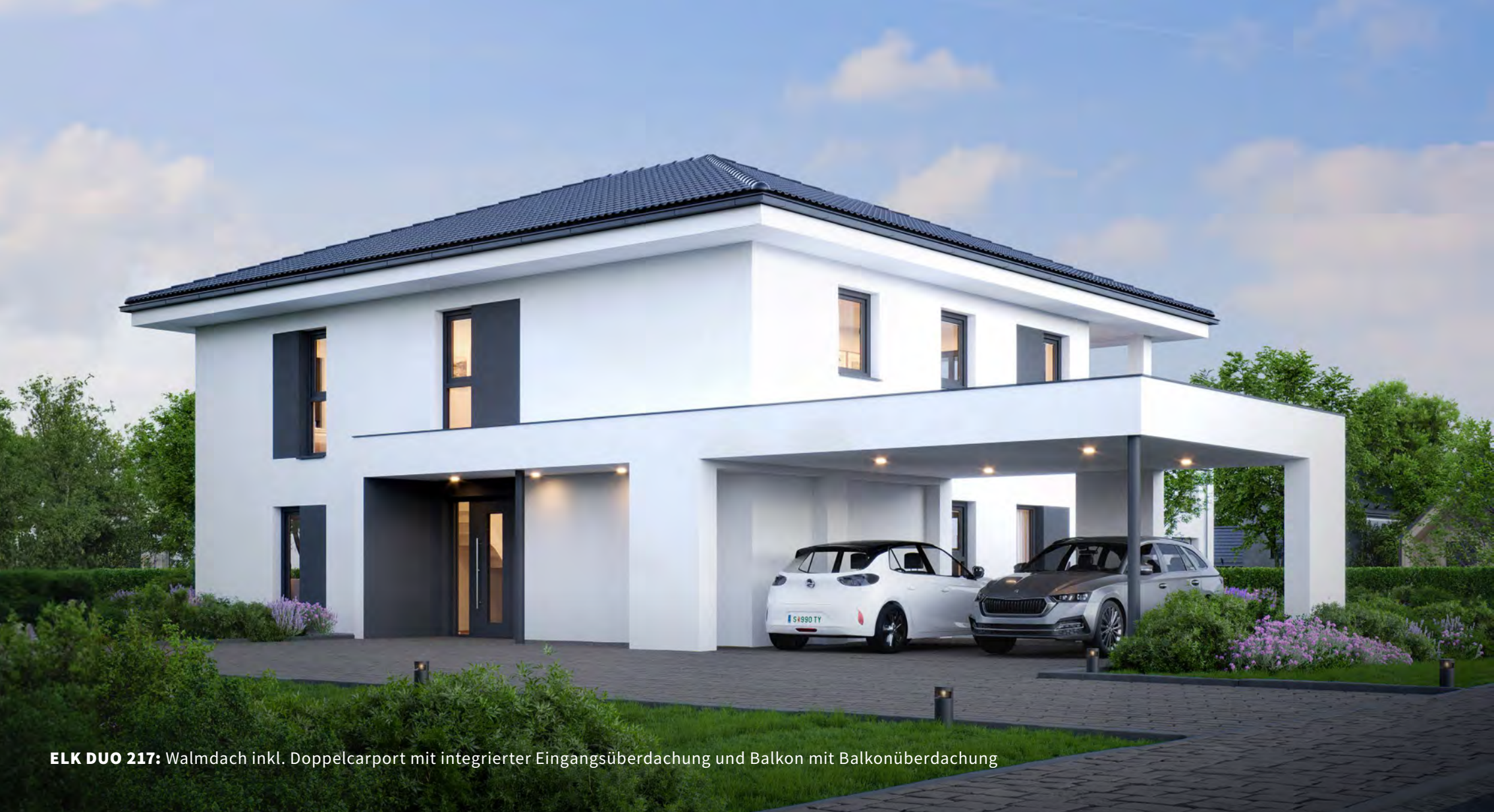
ELK DUO 217: Walmdach inkl. Doppelcarport mit integrierter Eingangsüberdachung und Balkon mit Balkonüberdachung