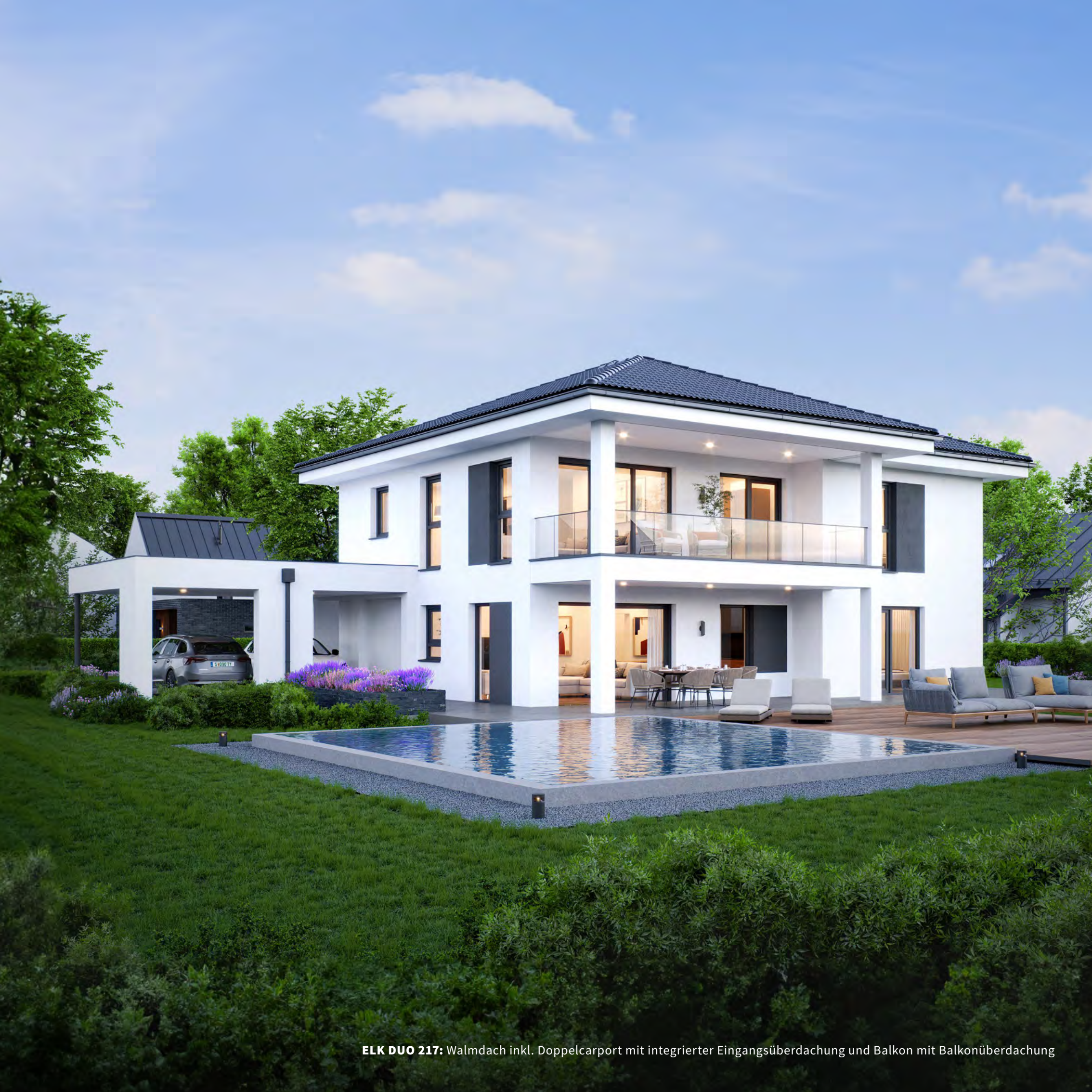
ELK DUO 217: Walmdach inkl. Doppelcarport mit integrierter Eingangsüberdachung und Balkon mit Balkonüberdachung