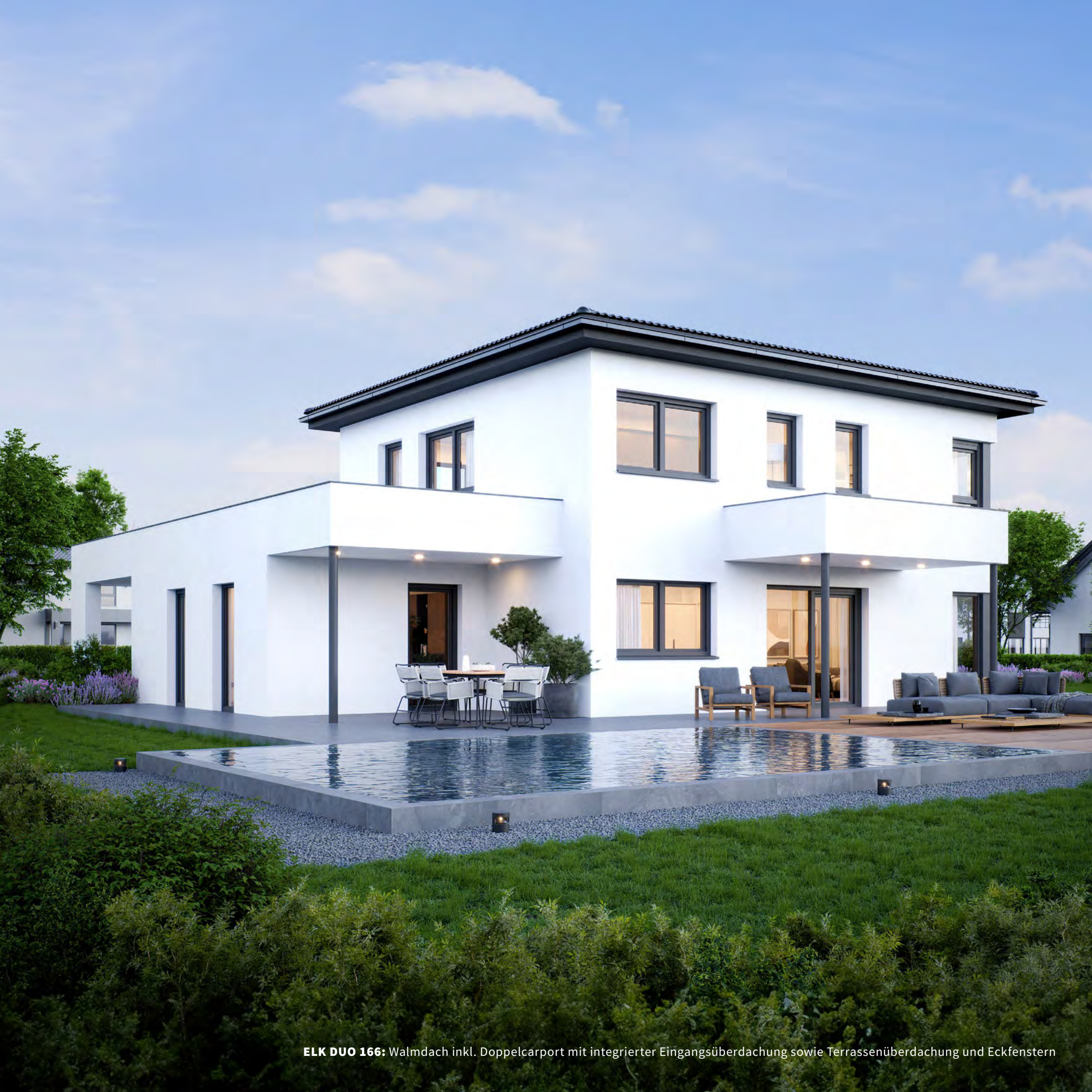
ELK DUO 166: Walmdach inkl. Doppelcarport mit integrierter Eingangsüberdachung sowie Terrassenüberdachung und Eckfenstern