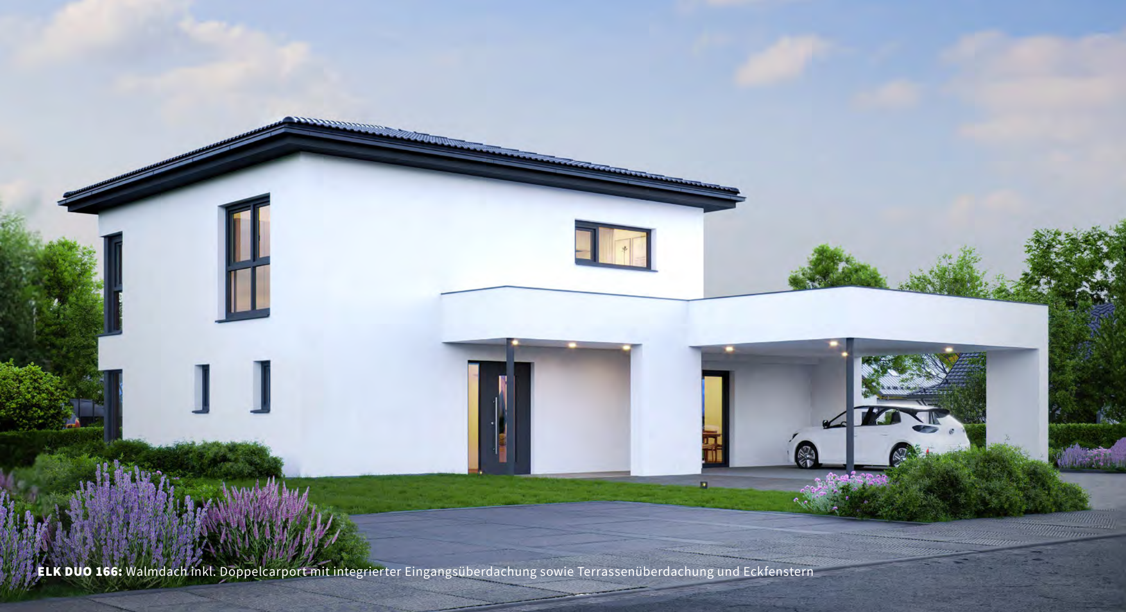
ELK DUO 166: Walmdach inkl. Doppelcarport mit integrierter Eingangsüberdachung sowie Terrassenüberdachung und Eckfenstern